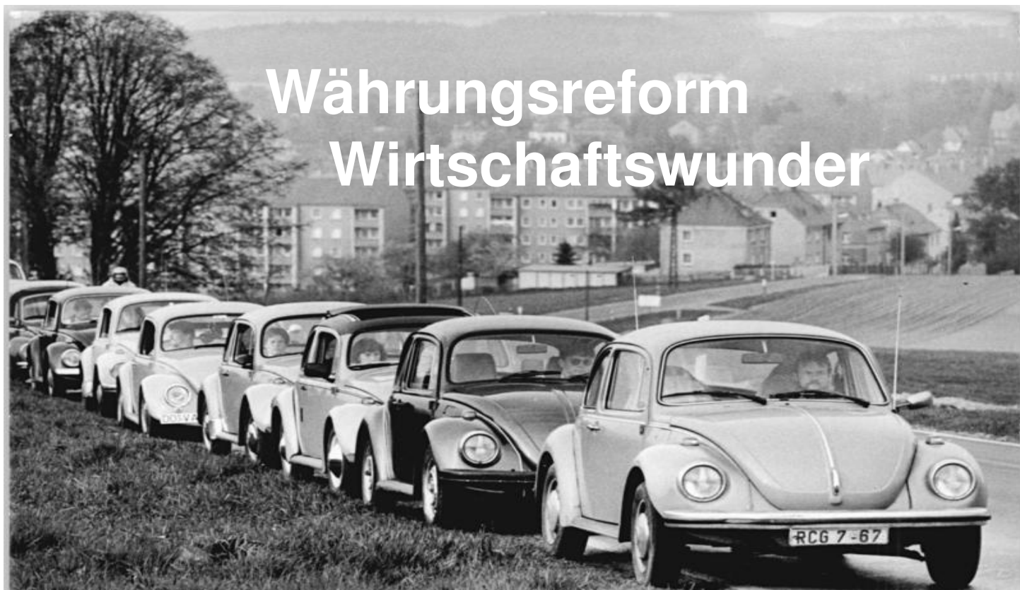
30. April 1990